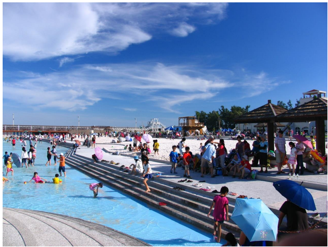
東石漁人碼頭的人潮:是商機還是破壞?