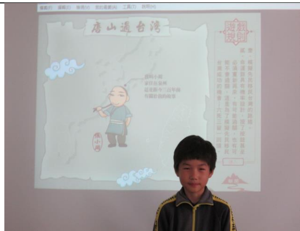
說明：以動畫遊戲方式加深對課程的了解