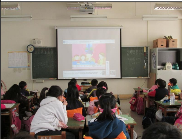
說明：觀賞唐山過台灣動畫