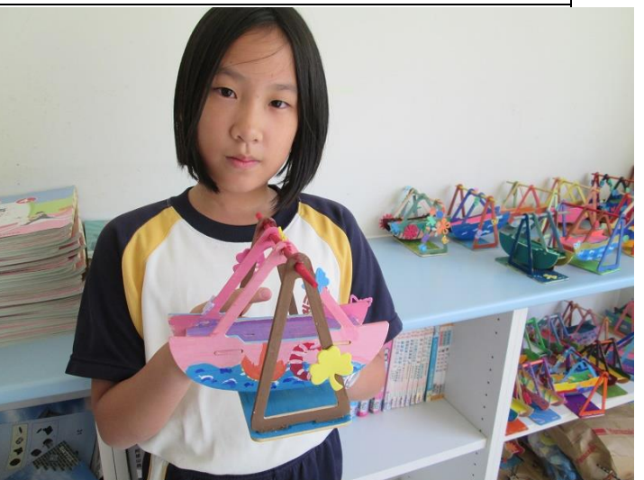
說明：學生及其作品合照