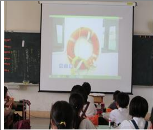
說明：學生觀看「海上安全」教學影片