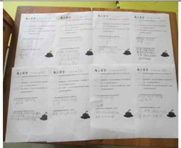
說明：「海上安全」學習單