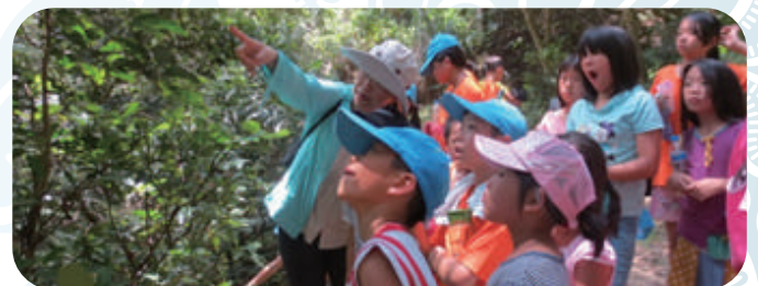
▲ 參觀海岸原生林的學習活動