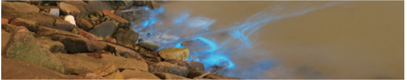
▲ 圖一、馬祖藍眼淚